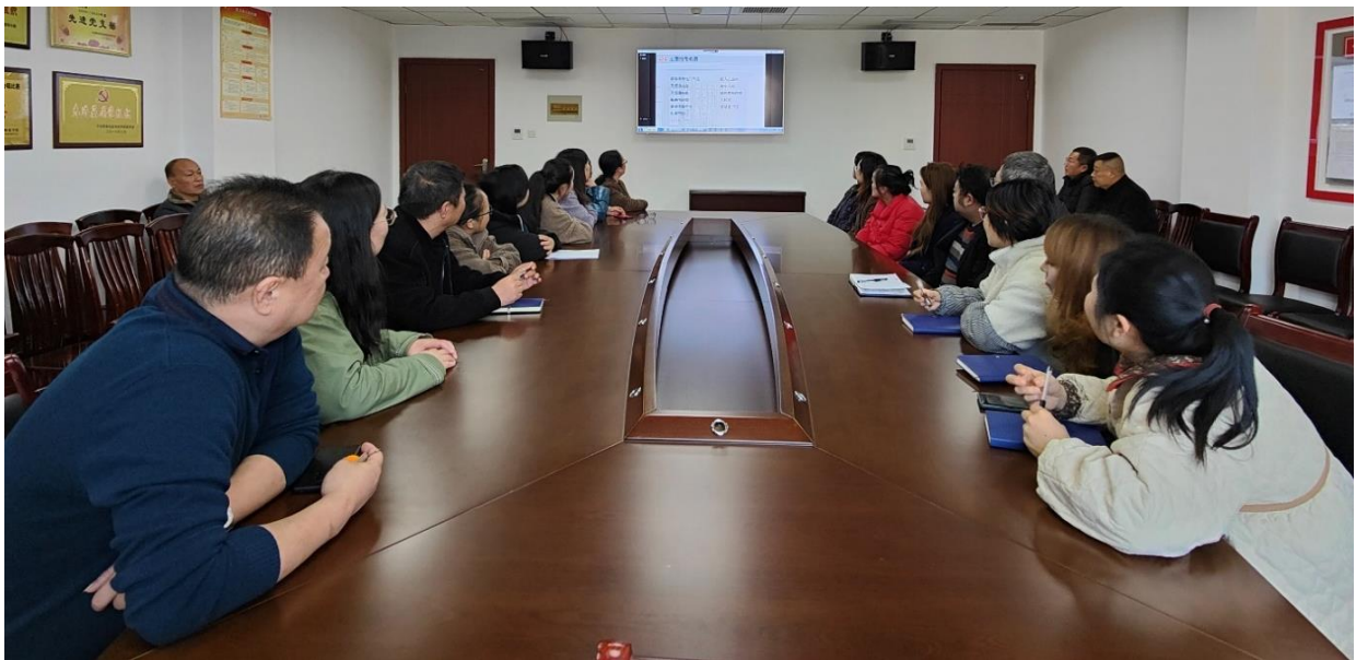
图1-2 黔南民族师范学院图书馆线上会议现场