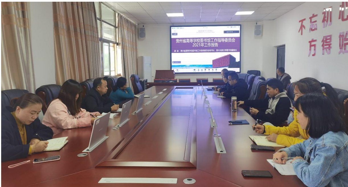
图1-4 凯里学院图书馆线上会议现场