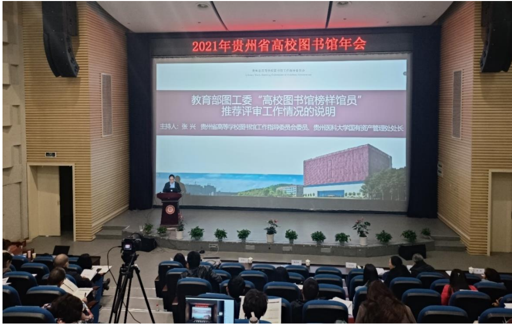
图8 政治学习与工作研讨