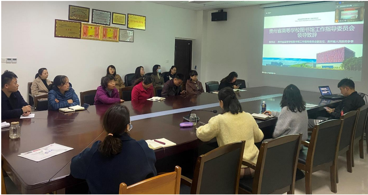
图1-3 贵州医科大学图书馆线上会议现场