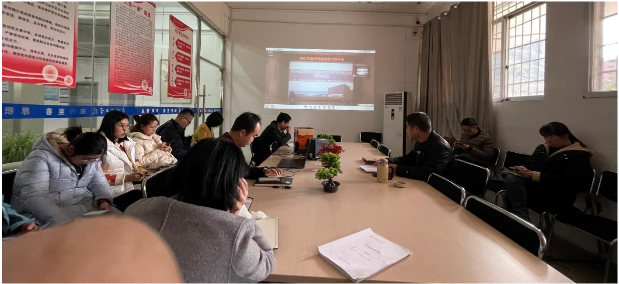
图1-5 贵州理工学院图书馆线上会议现场