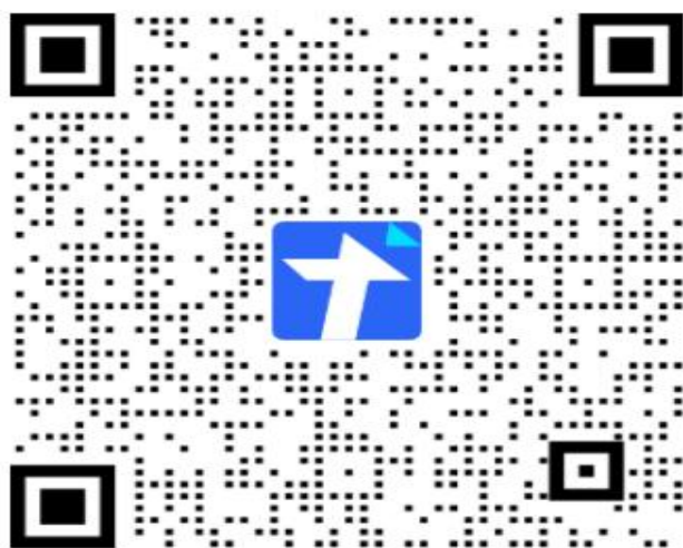
贵州民族大学2023年毕业生基层就业 学费补偿国家助学贷款代偿网报

手机扫描下方二维码填写《贵州民族大学2023年毕业生下基层就业学费补偿国家助学贷款代偿网报申请》。